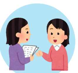
講座説明会のスタッフ