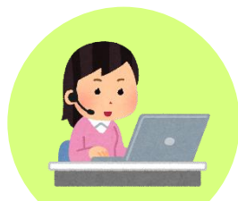
Web研修のサポート (Zoomの補助)