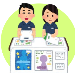
イベントの会場係員