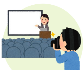
イベントの運営スタッフ