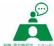
就職・再就職相談 カウンセリング