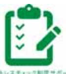
ストレスチェック制度サポート